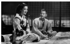
1949年／松竹株式会社 監督：小津安二郎 出演：原節子・笠智衆他

※バリアフリー映画会とは... 通常の映像に音声ガイド(活動弁士：佐々木亜希子氏)＋字幕で見る、目の見えない方や 耳の聞こえない方も、大人から子どもまで楽しめる映画会です。 ご案内時、手話通訳あり。